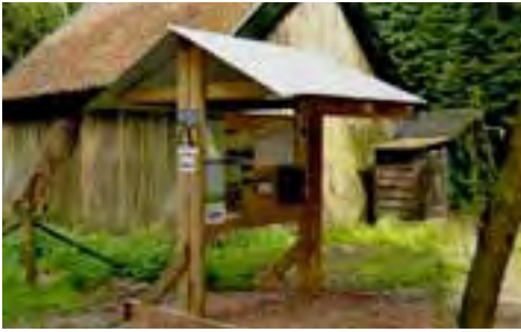
De ingang van het terrein aan de Renkumse Beek.

Aangetrokken door lyrische beschrijvingen hebben ondergetekenden een inspectie van dit grote terrein voor 60 tenten/caravans uitgevoerd. We achten dit terrein heel geschikt voor rustzoekende elektrogevoelige personen. Er is geen elektriciteit, dus geen aansluitpunten voor tent of caravan, geen laagfrequente velden. GSM ontvangst is slecht: zelden komt de hoogfrequent meter boven de 0,05 microWatt/m 2 . Alleen in het seizoensveld waar de gewone kampeerder overigens niets te zoeken heeft, staat een UMTS mast. Verder loopt daar ook de spoorlijn Utrecht - Arnhem waar treinen een gelijkmatige snelheid hebben. In het dichte geboomte is daar op een paar honderd meter afstand niets meer van te meten. Van Zuid (de ingang) naar Noord zijn er drie gebieden met speciale bestemming: trekkersveld voor kortverblijvers - toeristisch terrein voor langer