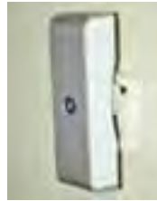
Memon Transformer: een heel gewicht aan het stopcontact, heel weinig effect op meetbare elektromagnetische velden en stroom in het elektriciteitsnet.

een thuismeting doen door twee memonverkoopers. Zij voelen dat het niet goed is daar en de celstress bij de medewerkster is hoog. De