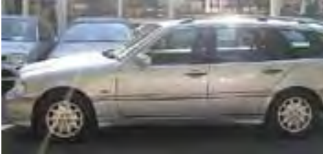
Voorbeeld van een bruikbare oude Mercedes: klassieke dieselmotor die weinig storing geeft op het boordnet.

komen door spanningsveranderingen, de laatste door stroomveranderingen.