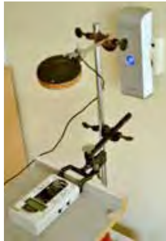
Voorbeeld van een test op magneetveldbeïnvloeding.. Een spoel (rond, zwart) wordt bekrachtigd door een 5 kHz wisselstroom en verspreid een veld waarvan de magnetische flux gemeten wordt met een ME3851A veldmeter. Gekeken wordt of na inpluggen van de Memon (rechtsboven) een verandering van het veld optreedt.

verandering bij het inpluggen er van. Vuile stroom werd gemeten met een Stetzerizer microsurge meter. Ultrasonische geluiden werden geanalyseerd met een 'bat detector'. Hoorbaar geluid en ozonproductie werden geregistreerd met menselijke receptoren. Negatieve ionen met een specifieke ionenmeter. Aanbeveling: Uit de tests volgt niet dat het apparaat aanschaf verdient om velden te verminderen. Als u het aanschaf omdat het er prachtig uitziet en u er de hoop uit put er beter van te worden kunt u dat doen. Schadelijke effecten zijn niet te verwachten